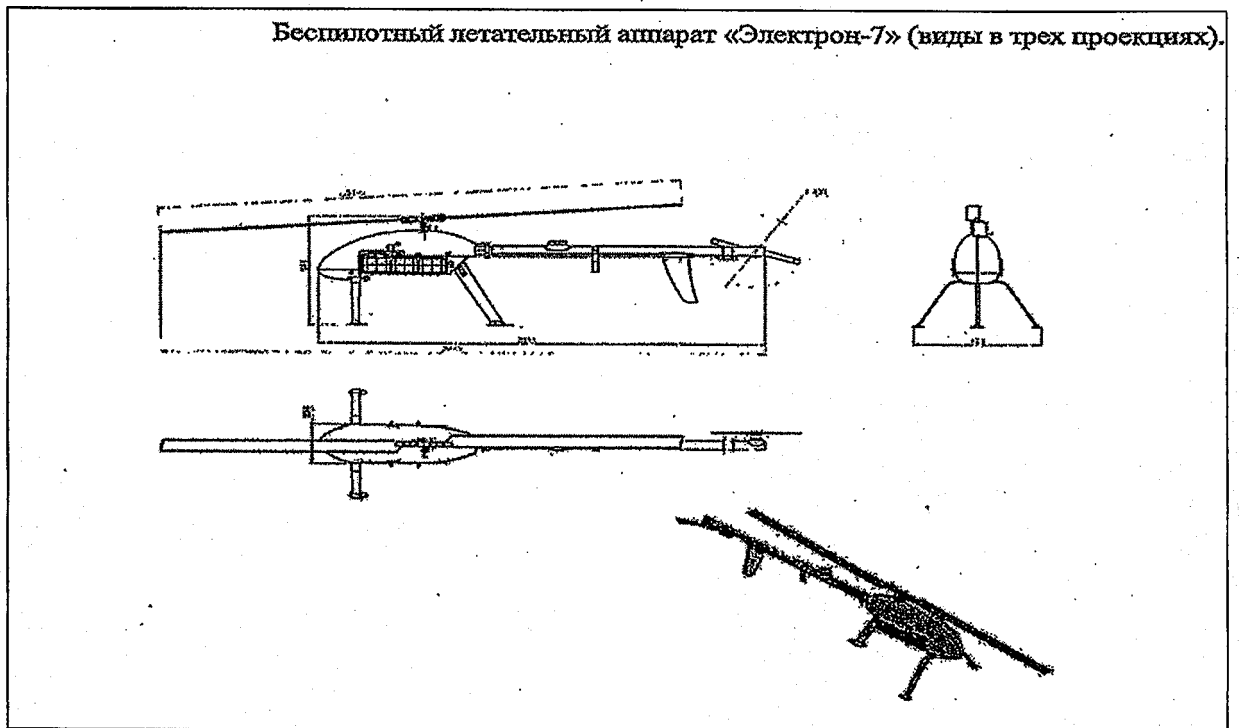
Рисунок 2. Изображение БЛА «Электрон» ООО «ЮВР»