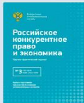
Специальный номер журнала «Российское конкурентное право и экономика» 2018г.