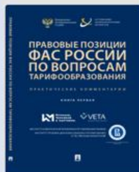
Правовые позиции ФАС России по вопросам тарифообразования. Практические комментарии 2019