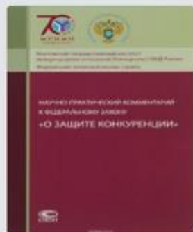
Научно-практический комментарий к Федеральному закону «О защите конкуренции» 2015