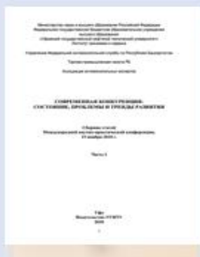
Сборник Уфимской конференции «Современная конкуренция» 2018