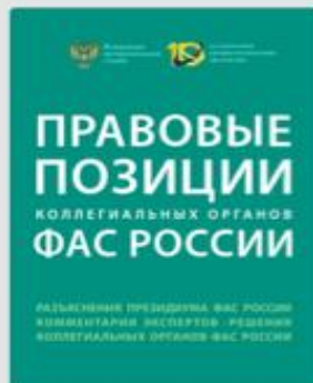
Правовые позиции коллегияльных органов ФАС России 2017