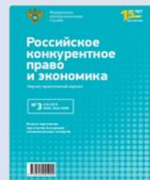
Специальный номер журнала «Российское конкурентное право и экономика» 2019 г.