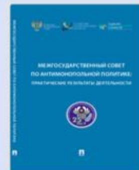
МСАП: практические результаты деятельности 2018