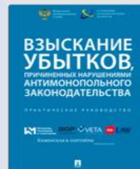
Взыскание убытков, причиненных нарушениями антимонопольного законодательства 2018