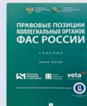
Правовые позиции коллегияльных органов ФАС России. Книга третья 2019