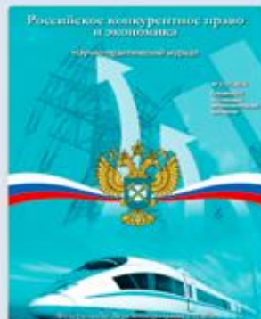
Специальный номер журнала «Российское конкурентное право и экономика» 2017 г.