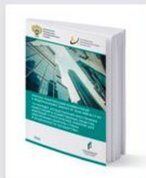
Научно-практический комментарий к Федеральному закону № 57-ФЗ 2018