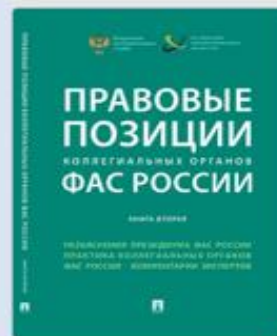
Правовые позиции коллегияльных органов ФАС России. Книга вторая 2018